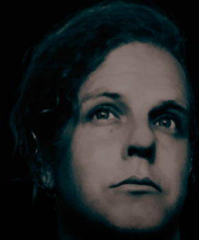
THOM BUERGIN GUITARS